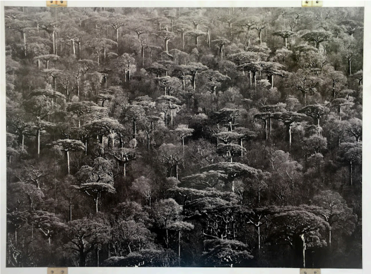
Del apartado Santuarios, el Baobab de Grandidier ( Adansonia Grandidieri ) , Madagascar 2010