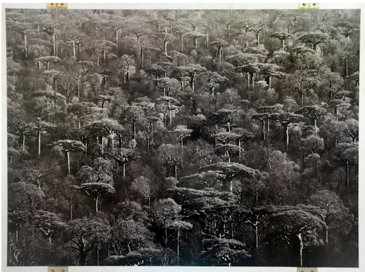
Del apartado Santuarios, el Baobab de Grandidier ( Adansonia Grandidieri ) , Madagascar 2010

Te pude gustar mas o menos su obra, pero no deja indiferente, y de entre la veintena o así de fotos que había, yo me quedo con estas dos, que me parecen fantásticas ambas dos.