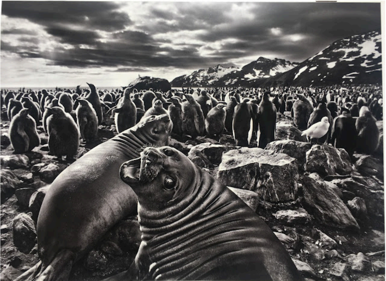
Del apartado Los confines del sur, crías de elefante marino antártico ( Mirounga leonina ) en la bahía de San Andrés. Georgia del Sur 2009